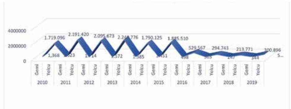
Grafik: Yıllar itibarı ile ülkemiz limanlarına gelen kruvaziyer gemi ve yolcu sayısı

2020 yılında ülkemiz limanlarına uğraması beklenen kruvaziyer gemi sayısında artış öngörülmüşken ve özellikle İstanbul'da Galataport Limanı'nın